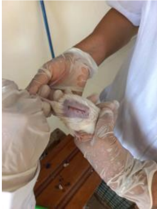
Fotografía N° 17: Realización de la incisión en el lomo del ratón