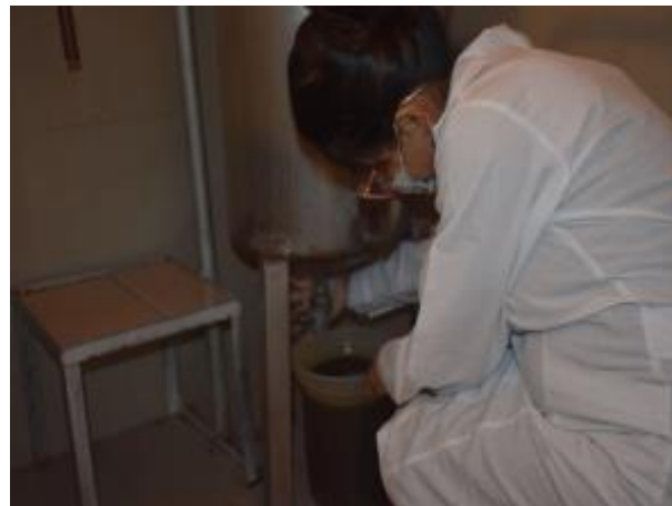
Fotografía N° 08: Maceración y extracción del principio activo