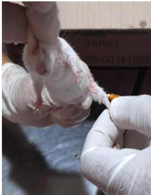
Fotografía N° 14: Administración de Ketamina para el anestesiado de los especímenes