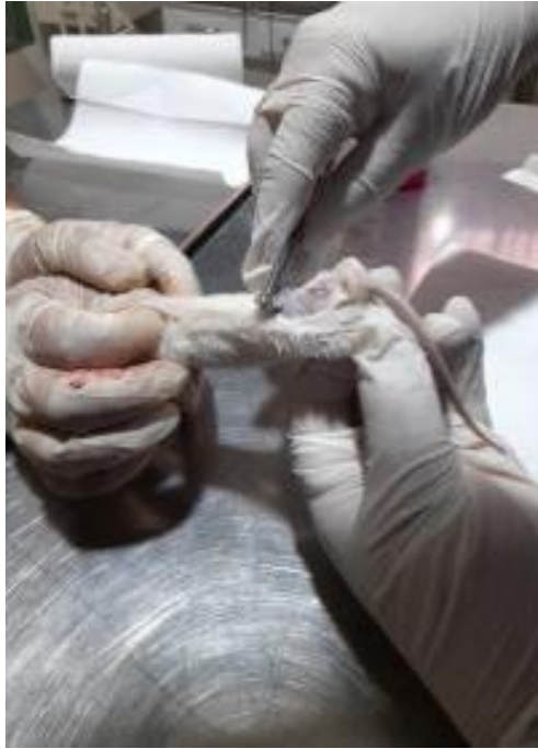
Fotografía N° 15: Depilación del lomo del ratón