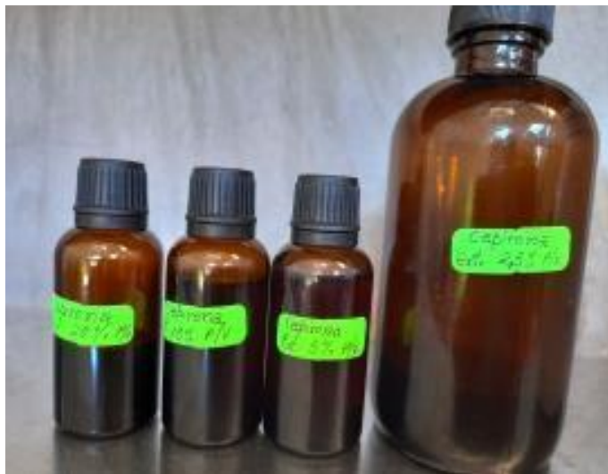
Fotografía N° 12: Obtención del extracto hidroalcohólico de capirona a diferentes concentraciones