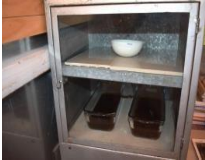
Fotografía N° 09: Reducción del principio activo