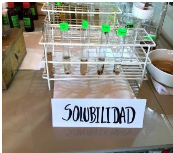
Fotografía N° 06: Prueba de solubilidad de Calycophyllum spruceanum (capirona de bajo)