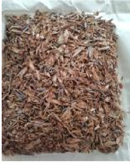
Fotografía N° 03: Secado de la corteza de Calycophyllum spruceanum (capirona de bajo)