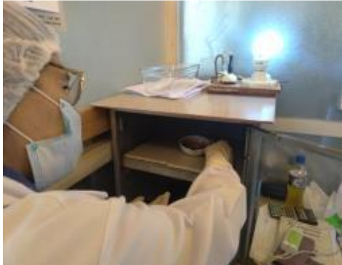
Fotografía N° 11: Proceso de secado de la melcocha