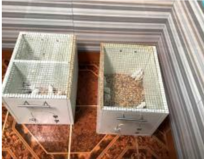
Fotografía N° 13: Proceso de selección y aclimatación de los especímenes de investigación en grupos de seis