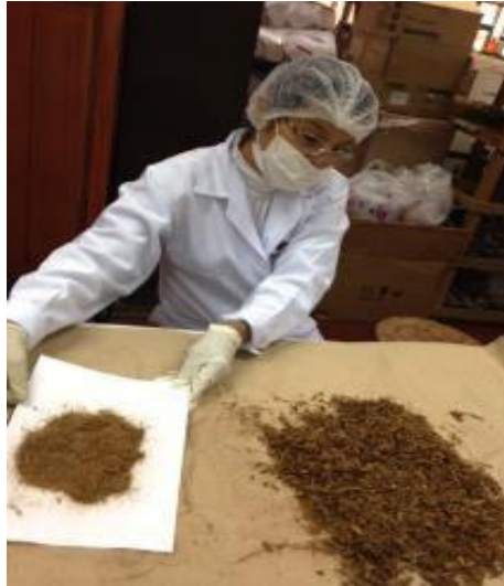
Fotografía N° 05: Molienda de la corteza de Calycophyllum spruceanum (capirona de bajo)