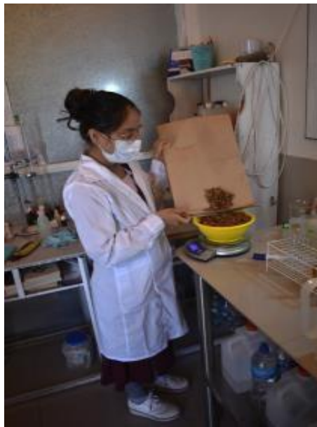
Fotografía N° 04: Pesado de la corteza de Calycophyllum spruceanum (capirona de bajo)