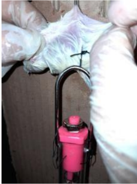
Fotografía N° 19: Realización de la prueba del dinamómetro