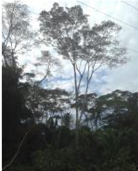
Fotografía N° 01: Especie vegetal Calycophyllum spruceanum (Benth.) Hook. f. ex K.Schum (capirona de bajío) en su hábitat natural