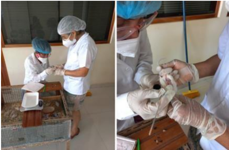
Fotografías N° 18: Administración vía tópica del extracto hidroalcohólico de capirona a los diferentes grupos de estudio