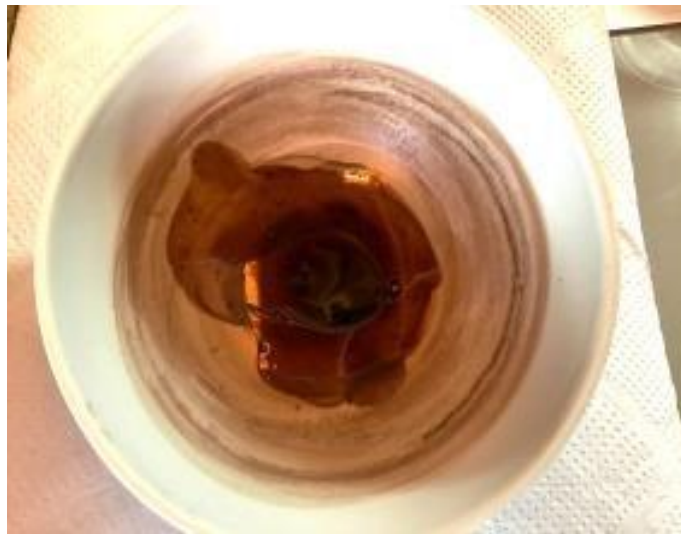
Fotografía N° 10: Melcocha en estado de gel