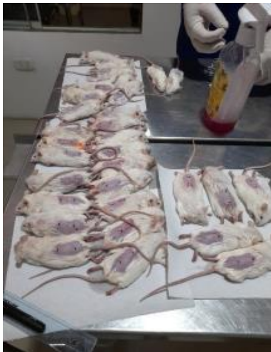
Fotografía N° 16: Medición y marcación del área (1 cm) de los especímenes