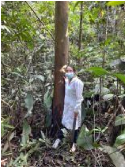
Fotografía N° 02: Recolección de la corteza de Calycophyllum spruceanum (capirona de bajío)