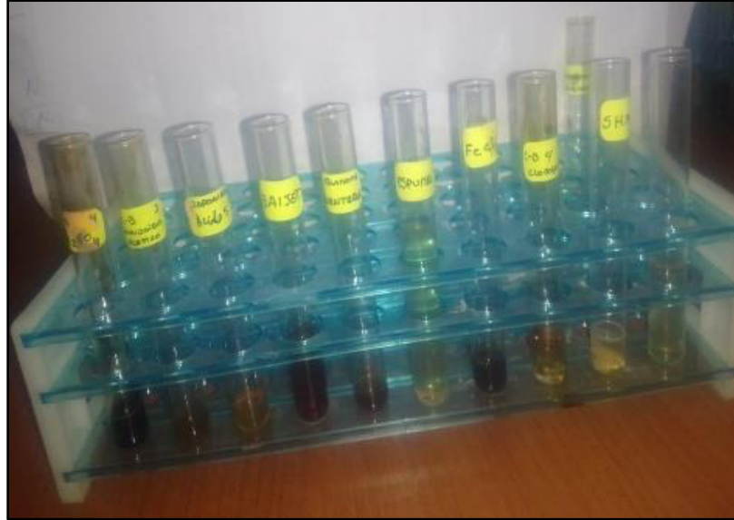
Figura 4. Resultados de solubilidad