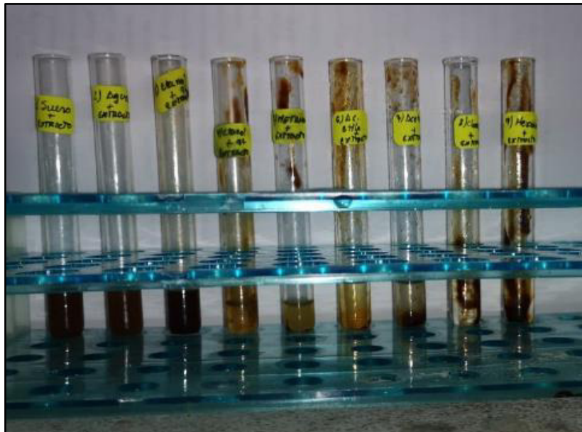
Figura 5. Resultado de fitoconstituyentes