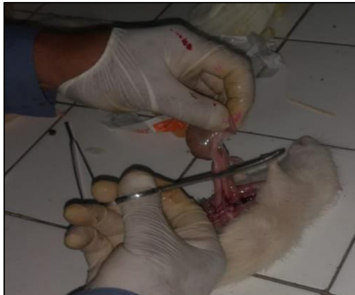
Figura 9. Extracción de los estómagos