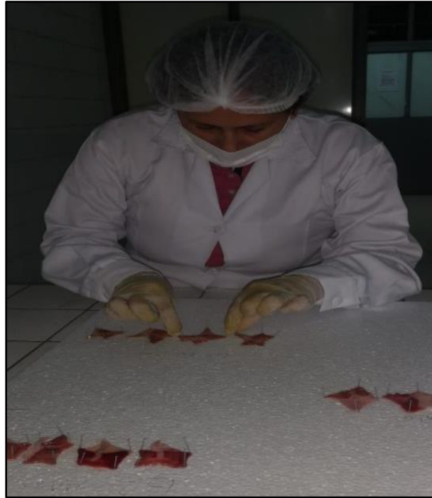
Figura 10. Verificación de las úlceras