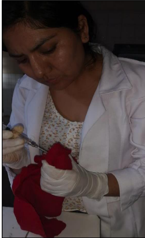
Figura 8. Administración del extracto de malva