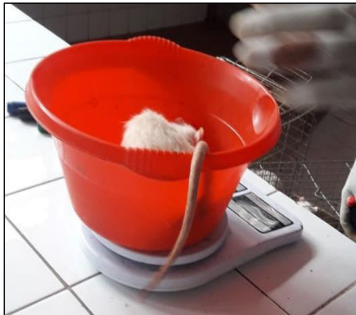
Figura 7. Pesado de las ratas