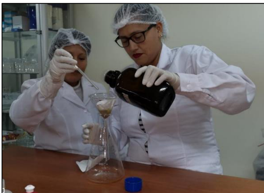
Figura 3. Proceso de filtrado de la maceración