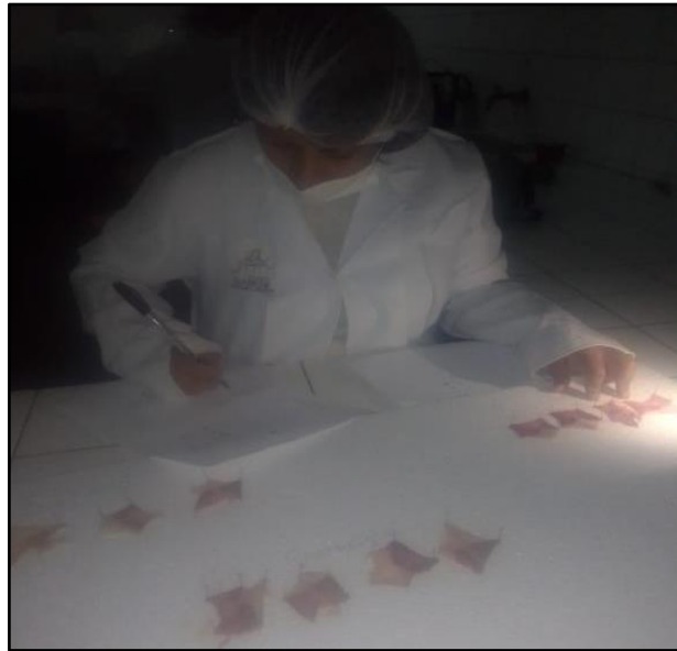
Figura 11. Conteo de los signos