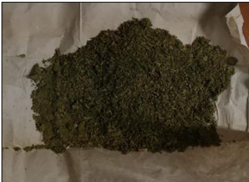
Figura 2. Hojas de malva seca triturada