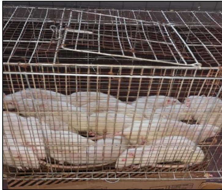
Figura 6. Ratas de experimentación en ayunas